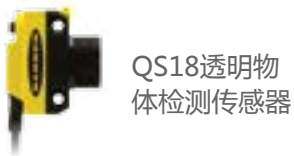
QS18透明物 体检测传感器