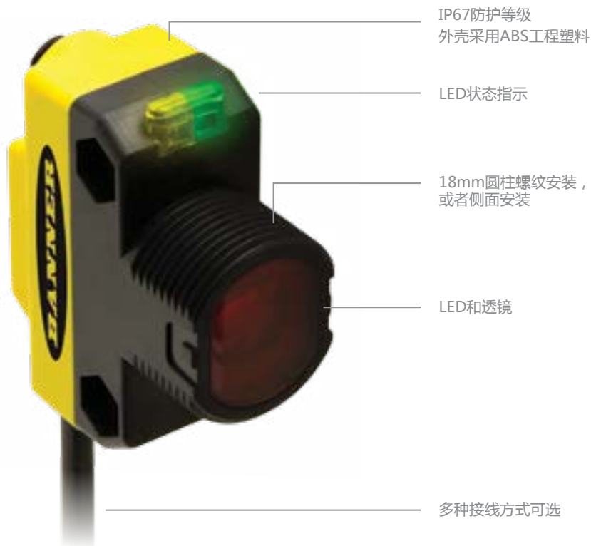
QS18透明物体检测传感器